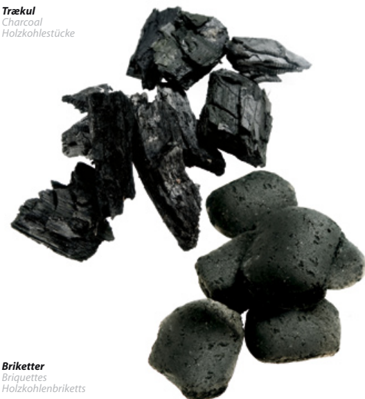
Briketter Briquettes Holzkohlenbriketts