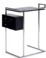
PETITE COIFFEUSE 1929