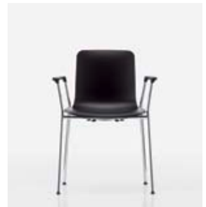
Auch die Variante mit Armlehnen ist stapelbar.