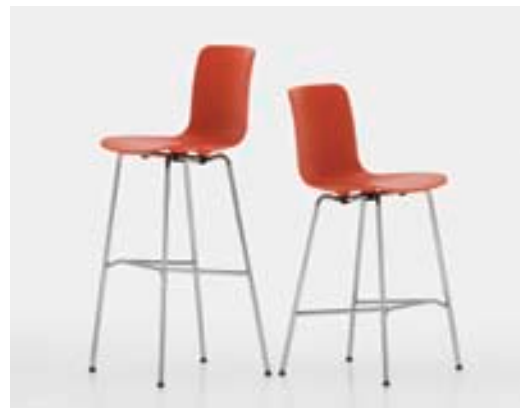
Die beiden hohen Varianten von HAL passen an Bars und an Countertische.