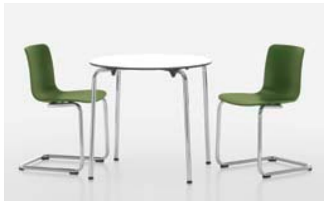
HAL Table eignet sich besonders für den Objektbereich, seine Beine können zur Lagerung einfach und schnell demontiert werden.

Im Vitra Test Center wird jedes Vitra-Produkt Prüfungen unterzogen, die seine 15-jährige Nutzung simulieren. So sind auch die Oberflächen und alle Einzelteile von HAL besonders widerstandsfähig; die Gestelle und Schalen haben keine sogenannten Schmutzfallen und sind leicht zu reinigen. Mit seinem Umweltlabel GREENGUARD ist HAL von Nutzen bei der Gebäudezertifizierung nach LEED, seine Materialien sind sortenrein trenn- und recycelbar.