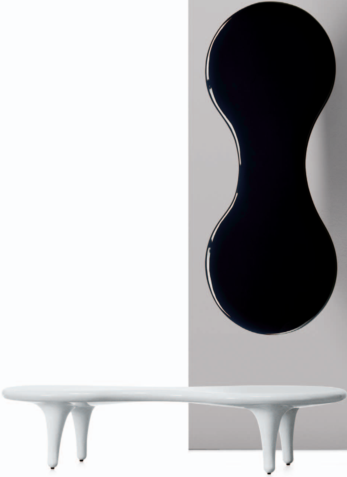
ORGONE TABLE Marc Newson 1998