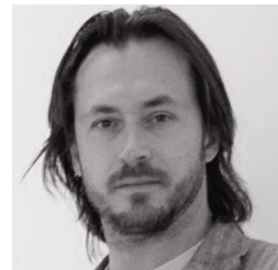
by D. Chancellor

Beistelltisch mit vier Beinen aus Glasfaserkunststoff, verfügbar in den Hochglanzfarben gelb, orange, rot, grün, blau, weiß und schwarz.