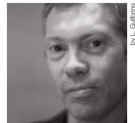
by L. Galbring

Nato a Londra nel 1959, si laurea al Royal College of Art e apre il suo primo studio nel 1986. Subito dopo inizia la lunga e interessante collaborazione che lo lega a Cappellini; oggi lavora fra Londra e Parigi per importanti nomi come Alessi, Flos, Rowenta, Sony e Samsung. Ogni suo progetto ha un'eleganza minimalista che lo rende estremamente moderno pur essendo una sorta di archetipo essenziale legato al passato, anteposto sempre la funzione all'espressione.