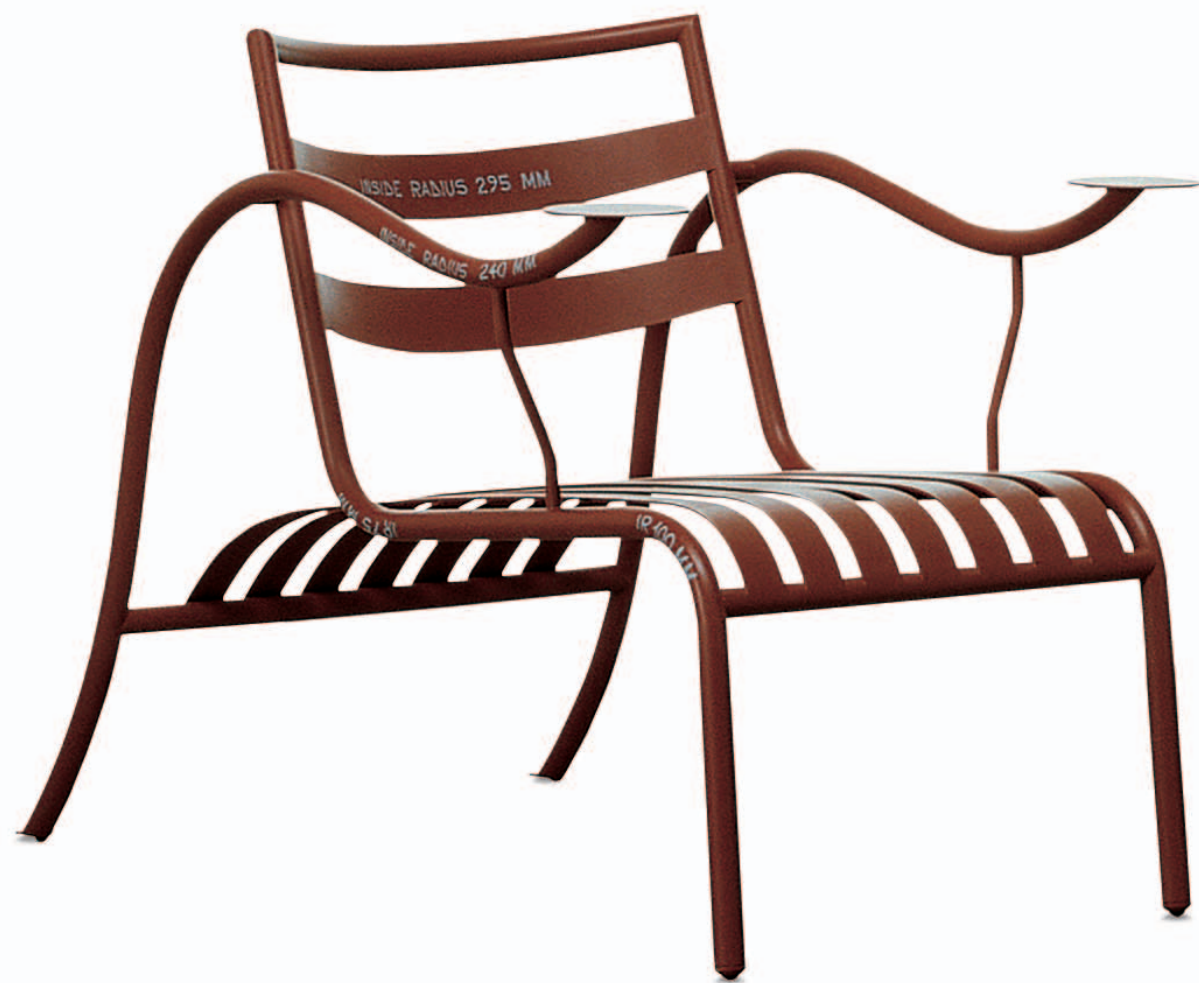
THINKING MAN'S CHAIR Jasper Morrison 1988