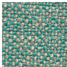
TYP / TYPE: EMERALD TÜRKIS MIT BEIGE / TURQUOISE WITH BEIGE

(50% LEINEN, 50% POLYCRY / 50% LINEN, 50% POLYACRYLICS)