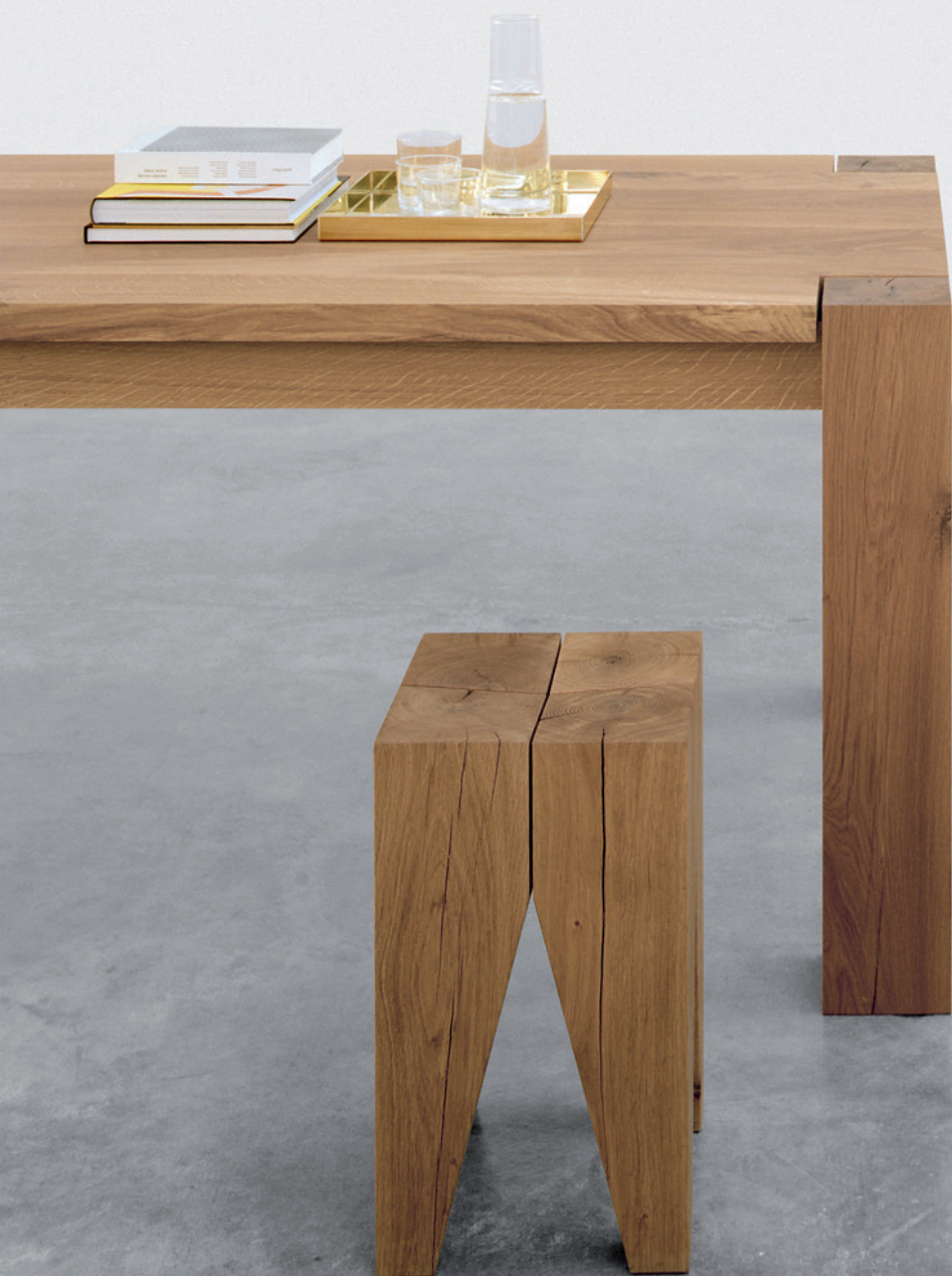
CM04 ITO TABLETT / TRAY MESSING / BRASS TA04 BIGFOOT™ TISCH / TABLE ST04 BACKENZAHN™ HOCKER / STOOL