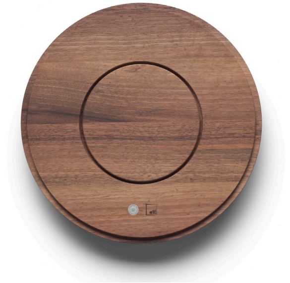
AC02 JEWEL SCHMUCKBEHÄLTNIS / JEWELLERY CASE EUROPÄISCHER NUSSBAUM, GEÖLT / EUROPEAN WALNUT, OILED