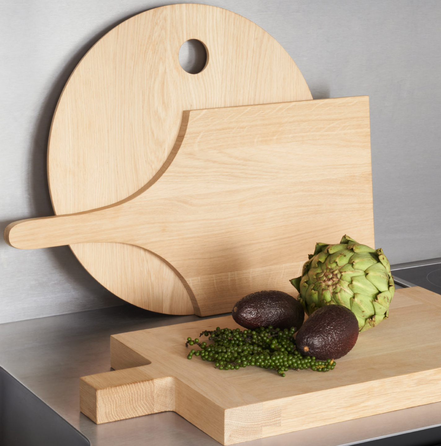
AC08 SLICE SCHNEIDEBRETT / CUTTING BOARD EUROPÄISCHE EICHE, GEÖLT / EUROPEAN OAK, OILED AC07 CUT SCHNEIDEBRETT / CUTTING BOARD AC06 CHOP HACKBRETT / CHOPPING BOARD